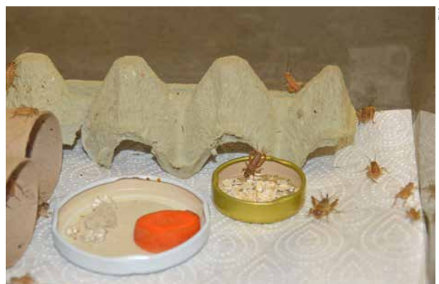
Anche gli animali da pasto hanno bisogno di spazio e cibo a sufficienza.