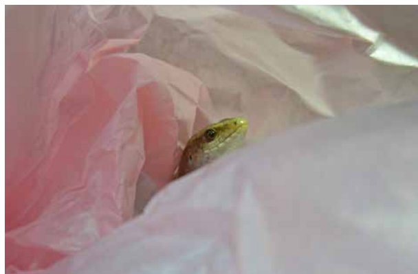
Questa carta per avvolgere i fiori ha suscitato grande interesse.

Alcune specie di sauri possono inoltre essere addestrate in modo tale da imparare dei semplici comandi.