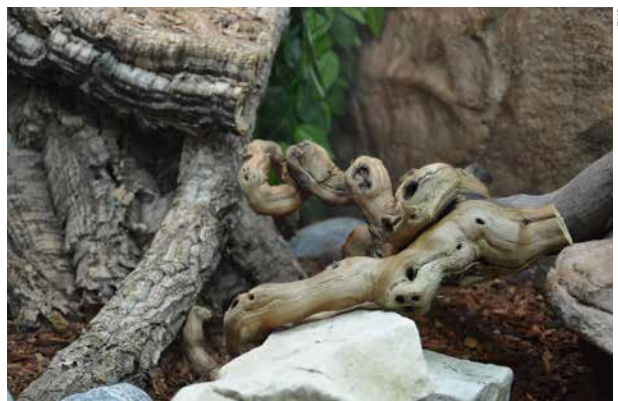
Oggetti naturali per l'arredo come pietre, rami, tubi di sughero ecc. consentono ai rettili di arrampicarsi e di ritirarsi.

Alimentazione: i rettili hanno un metabolismo più lento rispetto ai mammiferi e agli uccelli. Mentre le specie che si cibano di piante vanno di regola nutrite ogni giorno, molti rettili che mangiano carne e insetti non hanno bisogno di essere nutriti tutti i giorni. Per i serpenti adulti è consigliato a seconda della specie un intervallo nell'alimentazione di ca. 2–4 settimane. Secondo la specie, i sauri adulti che si cibano di carne o di insetti hanno bisogno di nutrirsi ca. 1–3 volte a settimana. Gli animali giovani vanno invece alimentati più spesso. La letteratura specializzata indica la frequenza dell'assunzione di cibo tipica della specie. Pesando regolarmente gli animali è inoltre possibile constatare variazioni di peso e adeguare l'alimentazione qualora fosse necessario.