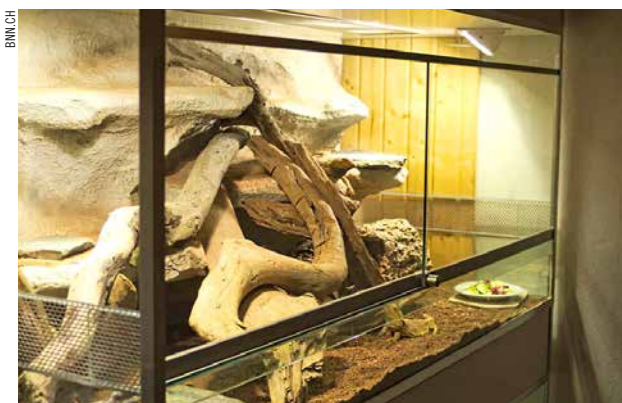
Esempio di un terrario secco.

Terrario umido: nei terrari umidi vengono sistemati, fra gli altri, gli abitanti delle foreste pluviali tropicali come per esempio i draghi d'acqua. Nei terrari umidi l'umidità dell'aria supera di regola il 70%. A causa dell'elevata umidità dell'aria i terrari sono preferibilmente costruiti in vetro o plastica. Se viene utilizzato il legno, va trattato appositamente. Per evitare danni provocati dall'acqua nell'appartamento, il terrario deve essere costruito a prova di perdite. Al tempo stesso il terrario non deve diventare paludoso, per cui potrebbe essere necessario apporre sul fondo uno strato de-