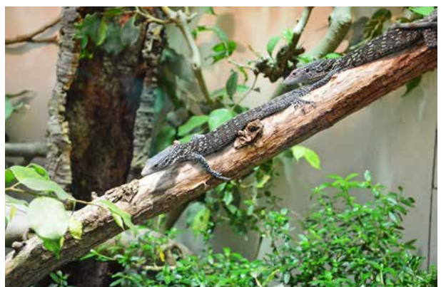
Esempio di un terrario umido.